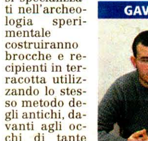
GAVIANO «Sul santuario di epoca nuragica costruiremo il nostro futuro turistico»

SARCIDANO. La vera novità in Sardegna è l'archeologia sperimentale introdotta dall'Issep nell'ambito di un programma triennale finanziato dall'unione Europea e che punta a valorizzare il patrimonio storico presente nei paesi del Consorzio turistico dei due laghi tra Sarcidano e Barbagia di Seulo. Previste quest'anno anche altre rassegne nella Sardegna dell'interno, dopo il successo dell'edizione 2008 ospitata al nuraghe Arrubiu di Orroli. «Il 13 giugno - spiega la studiosa Giusi Gradoli - saremo presenti a Esterzili, nel tempio a megaron di Domu de Orgia. Dal 20 luglio al primo agosto andremo a Sadali, mentre dal primo al 4 ottobre organizzeremo il festival internazionale di arte e scienze tra Siurgus Donigala, Esterzili e Goni».